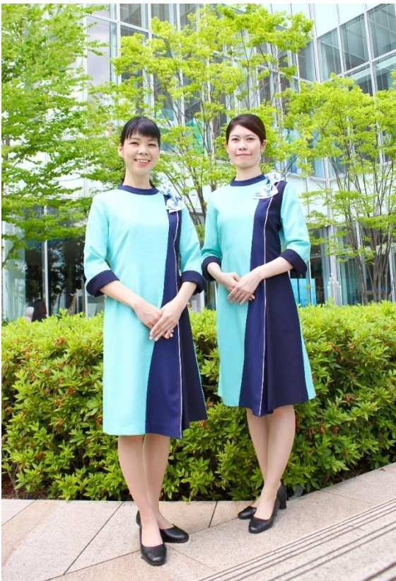
【新制服デザイン着用イメージ】

新しい制服の導入により、5周年という節目に新しい気持ちでお客様をお迎えするとともに、お客様にあべのハルカス美術館での非日常体験を楽しんでいただけるよう高品質なサービスの提供に努めてまいります。