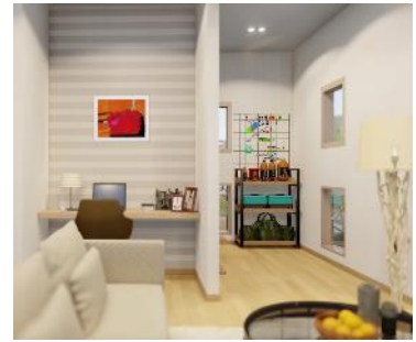
「ココチスペース®」(左)ファミリールーム(右)