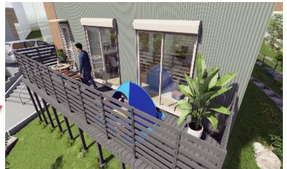
バーベキューやヨガなど多彩に活用できる ガーデンテラス(ウッドデッキ)