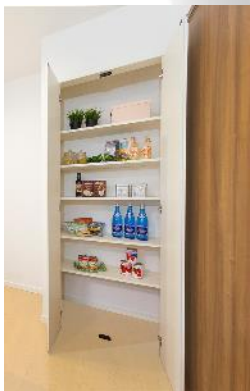
キッチン横のパントリーを はじめ、適材適所を考えた 収納スペース