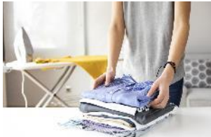
家事のスペースとして使える 1階の「ココチスペース®」