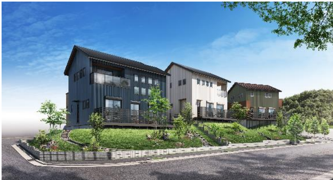
生駒・菊美台「Nature Style(ネイチャースタイル)」イメージ

※所要時間の記載について、今回登場する該当住戸の最長を記載しており、駅最寄り住戸は6分となります。