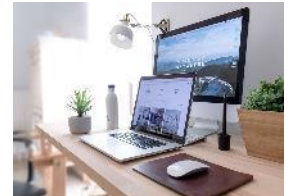
「ココチスペース®」は、 在宅ワークに最適