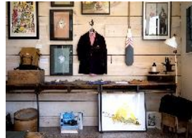
ファミリールームは趣味の道 具の収納や屋内キャンプにも