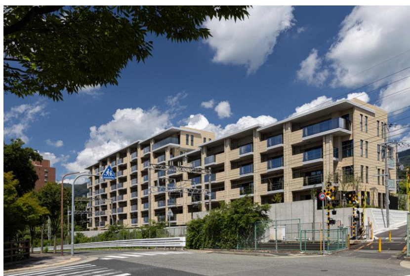
南側外観（香雪美術館側）

全邸南向き全 19 タイプの住戸プラン(53 m 2 ~183 m 2 台)は、2LDK~4LDK となっており、最上階には 140 m 2 ~183 m 2 台のプレミアムプランを設定。住まう方々の多彩なライフスタイルにお応えできるようバリエーション豊かな住戸プランをご用意いたしました。メインエントランス棟は、行き交う人々を迎え入れる邸宅の「顔」として独立した一棟での計画とし、ゆとりのあるアプローチやガーデン、車寄せといった邸宅としての在り方を魅せられるような空間構成を目指しました。グランドロビーは高さ5mを超える壮大な吹き抜け空間とし、地域に馴染みのある御影石で仕上げました。グランドロビーから住宅棟へと続くアプローチや、そこに併設するオーナーズラウンジでは、六甲山麓の風光に恵まれた枯山水のセンターガーデンが人々を上質な体験の場へお連れいたします。