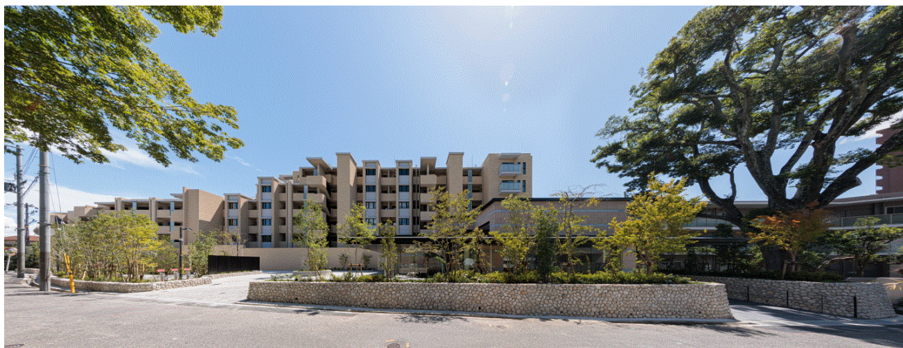
北側アプローチ全景

全邸南向き全 19 タイプの住戸プラン(53 m 2 ~183 m 2 台)は、2LDK~4LDK となっており、最上階には 140 m 2 ~183 m 2 台のプレミアムプランを設定。住まう方々の多彩なライフスタイルにお応えできるようバリエーション豊かな住戸プランをご用意いたしました。メインエントランス棟は、行き交う人々を迎え入れる邸宅の「顔」として独立した一棟での計画とし、ゆとりのあるアプローチやガーデン、車寄せといった邸宅としての在り方を魅せられるような空間構成を目指しました。グランドロビーは高さ5mを超える壮大な吹き抜け空間とし、地域に馴染みのある御影石で仕上げました。グランドロビーから住宅棟へと続くアプローチや、そこに併設するオーナーズラウンジでは、六甲山麓の風光に恵まれた枯山水のセンターガーデンが人々を上質な体験の場へお連れいたします。