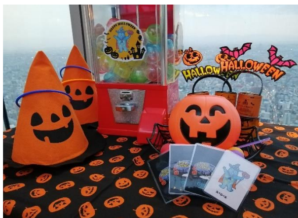
【ハルカスハロウィンカーニバル（イメージ）】