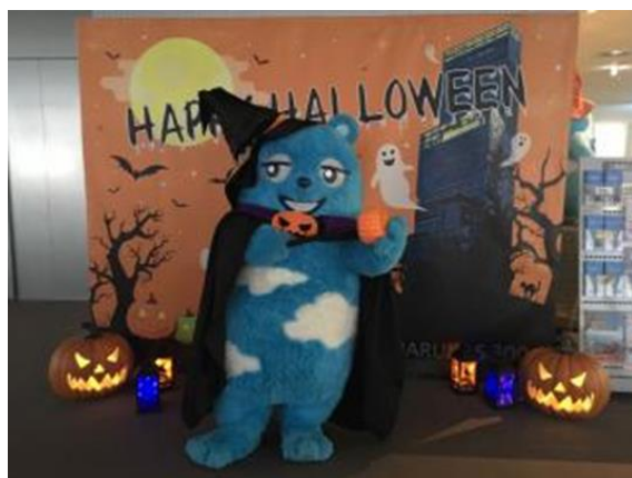
【昨年のあべのべあハロウィングリーティング】