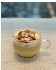
キャラメルパンプキンラテ （税込650円）