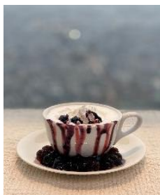
おどろおどろしいタピオカ （税込600円）