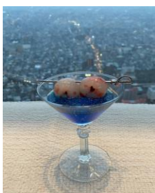
ギョギョギョ!!なカクテル （ノンアルコール税込600円） （アルコール税込650円）