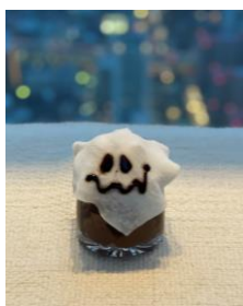
ゆら～りゆら～りおばけココア （税込700円）