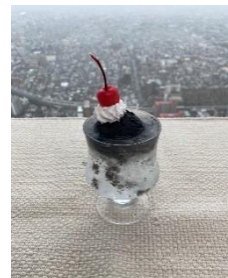
不気味なクリームソーダ （税込700円）